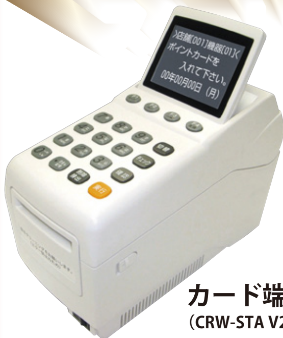
カード端末 (CRW-STA V2)